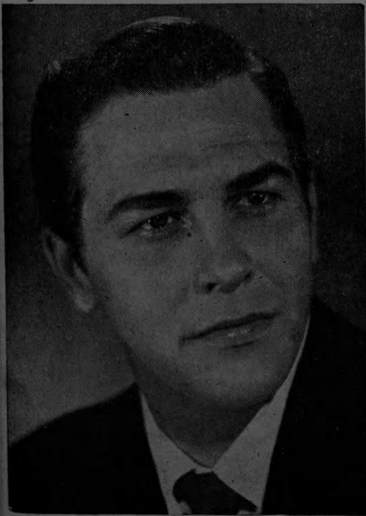
HOWARD KEEL, Actor de la Metro Goldwyn Mayer

Los expertos de Hollywood aseguran que Howard Keel puede considerarse ya entre las luminarias que fulguran en el cielo de la meca cinematográfica.